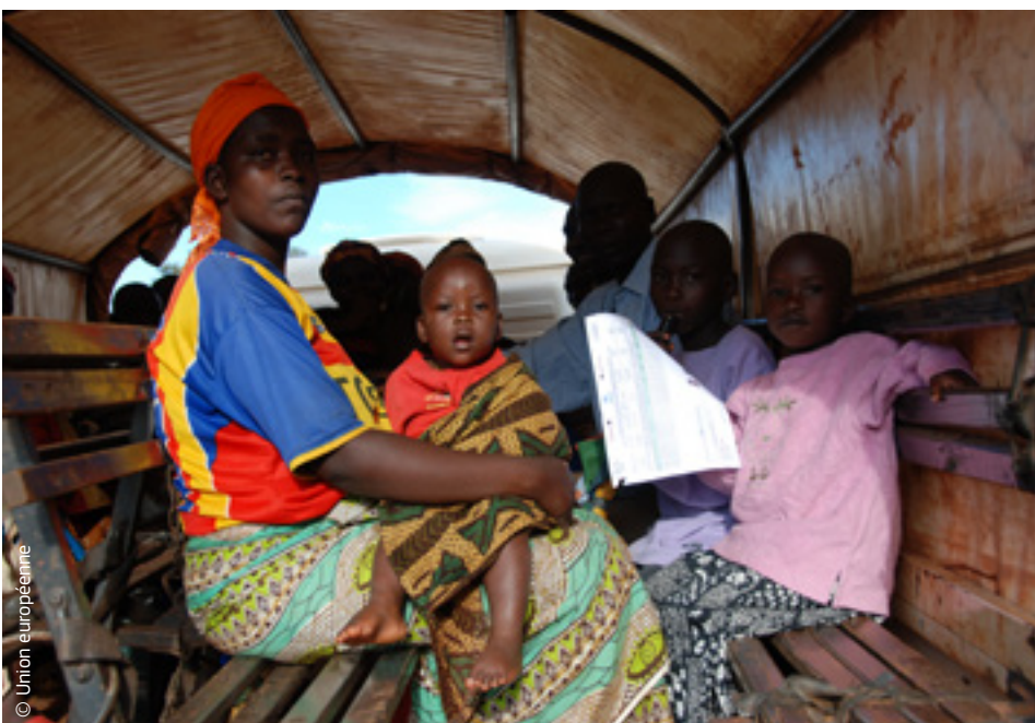
Cette famille burundaise déplacée a pu retourner chez elle grâce à l'aide à la réinstallation de l'UE.

Un sondage Eurobaromètre réalisé en 2015 a révélé que le grand public soutenait de plus en plus massivement le travail humanitaire de l'Union et l'approche conjointe vis-à-vis de la protection civile. Neuf citoyens sur dix estiment qu'il est important que l'UE continue à financer l'aide humanitaire, et huit citoyens sur dix ont déclaré