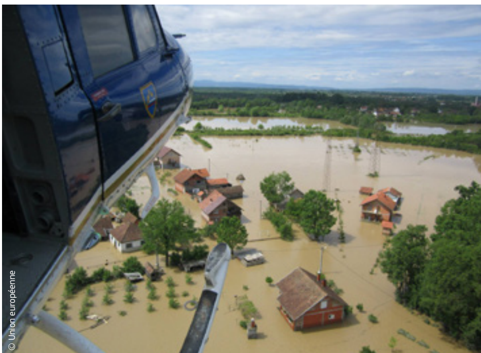
Un hélicoptère slovène, envoyé dans le cadre du mécanisme de protection civile, apporte du matériel d'urgence aux populations touchées par les inondations en Bosnie-Herzégovine.

Outre l'aide matérielle fournie par les États membres de l'UE dans le cadre du mécanisme de protection civile, l'UE a alloué 3 millions d'euros d'aide humanitaire pour aider les populations les plus vulnérables. Cette aide a permis de secourir près d'un demi-million de personnes, mais d'importants travaux de remise en état et de reconstruction doivent encore être effectués dans les deux pays.